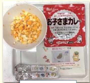
全卵ゆで卵とカレー